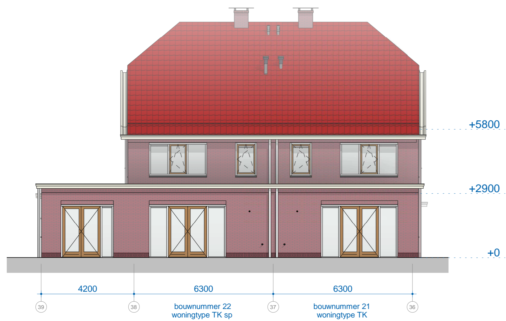
B4 achtergevel 1 : 100