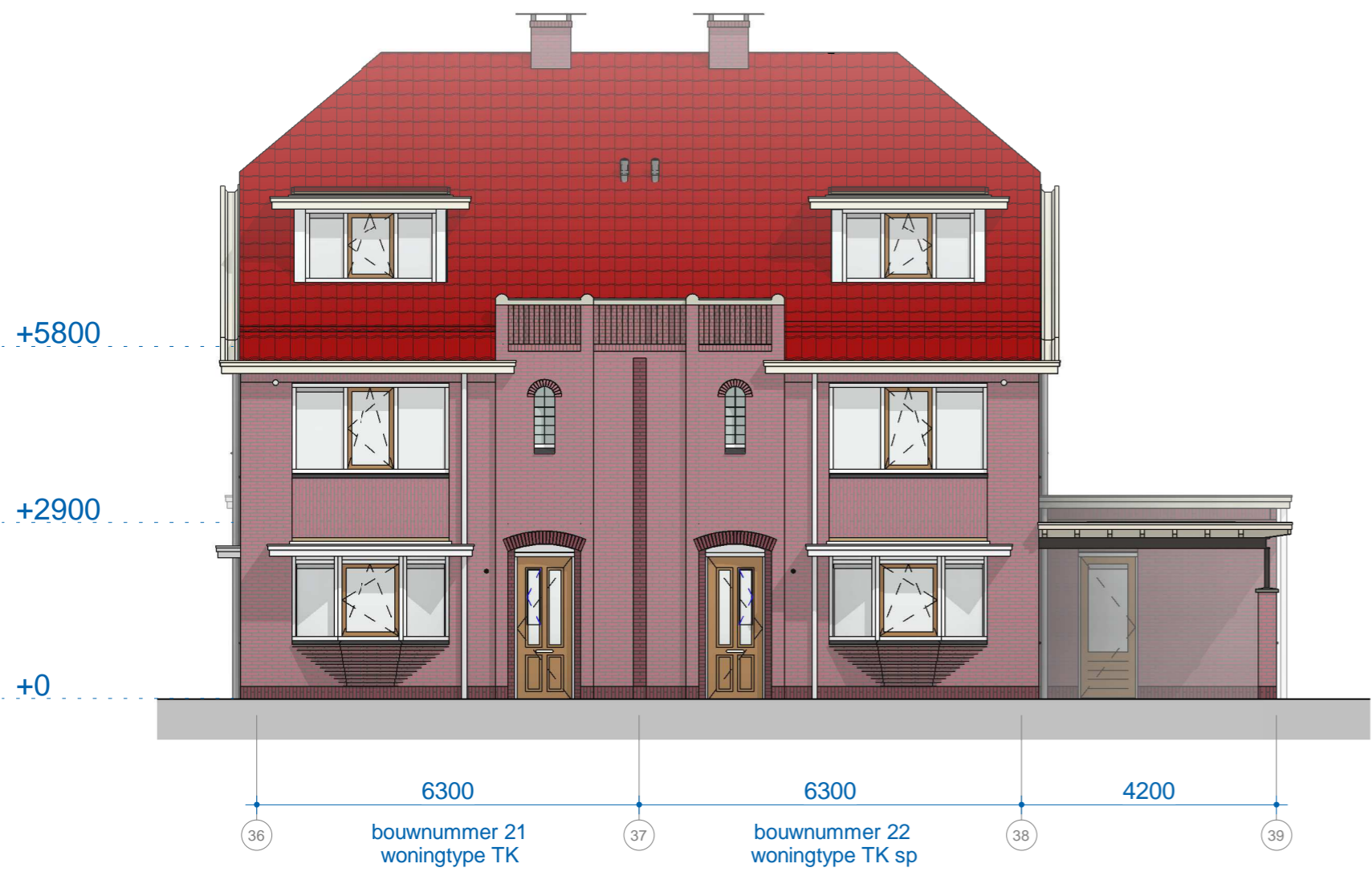
B4 voorgevel 1 : 100