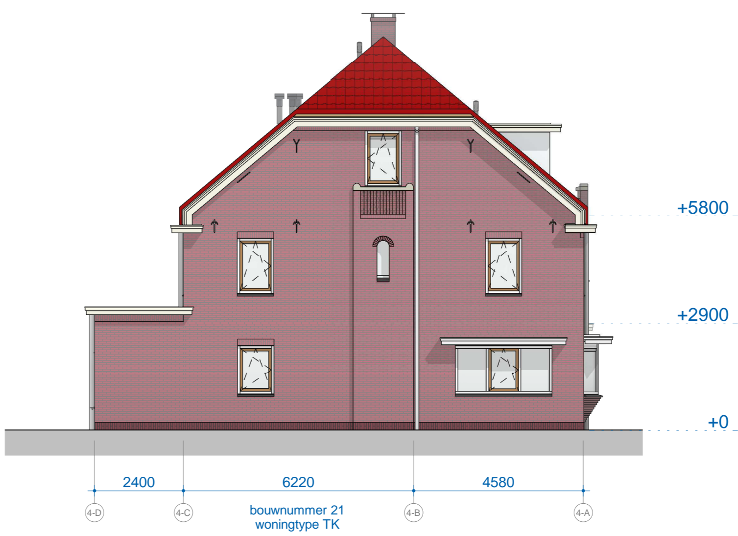
B4 linkergevel 1 : 100