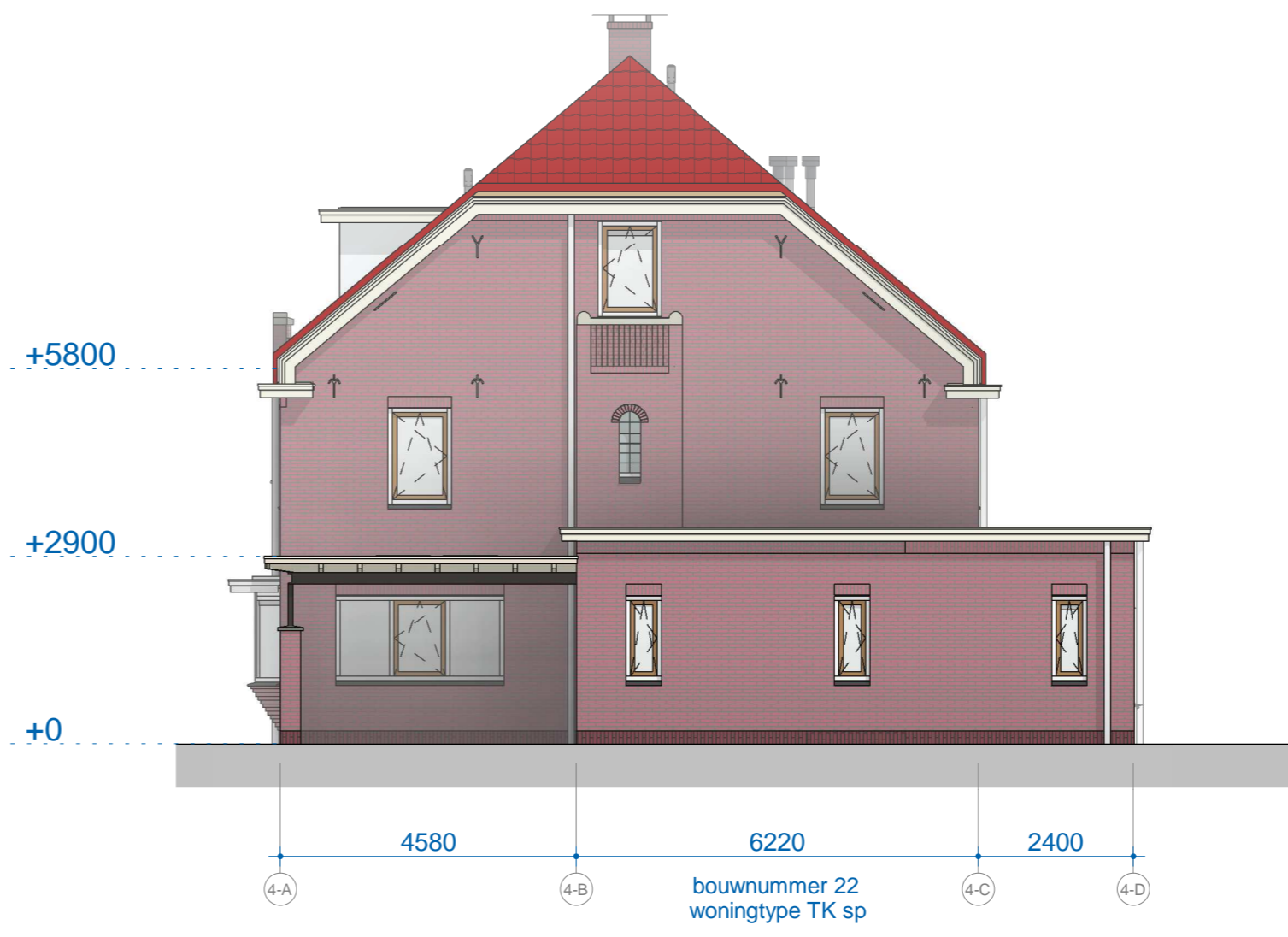
B4 rechtergevel 1 : 100